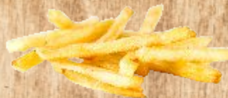
Рис припущенный 1200 тг Картофель фри 1400 тг Картофельные крокеты 1400 тг Картофельные дольки 1400 тг

Овощи гриль 2000 тг Луковые кольца 1700 тг Картофельное пюре 1500 тг Картофель по-домашнему 1400 тг