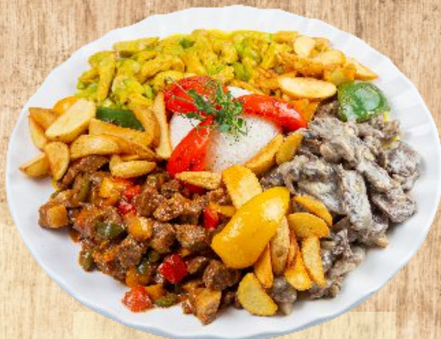
Ассорти «Кантри» 40 000 тг Баранина с овощами, говядина с грибами, курица в соусе карри, рис, фри, перец болгарский

Мясной микс гриль 60 000 тг (цыпленок, антрекот из баранины, говяжьи стейк, стейк из конины, люля кебаб из баранины, картофель, соус деми-глас)