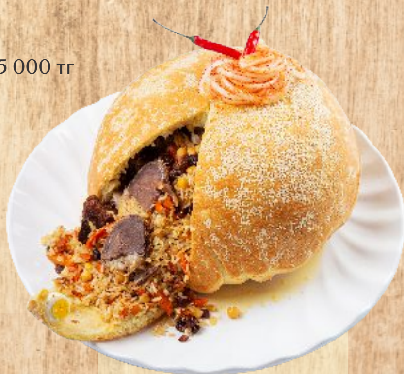
Шах-плов 35 000 тг