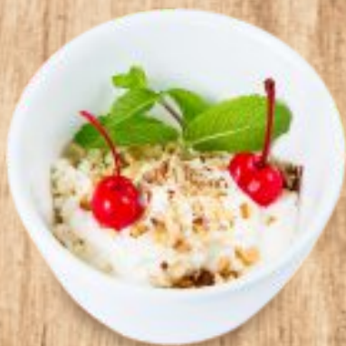
Творог со сметаной 1500 тг