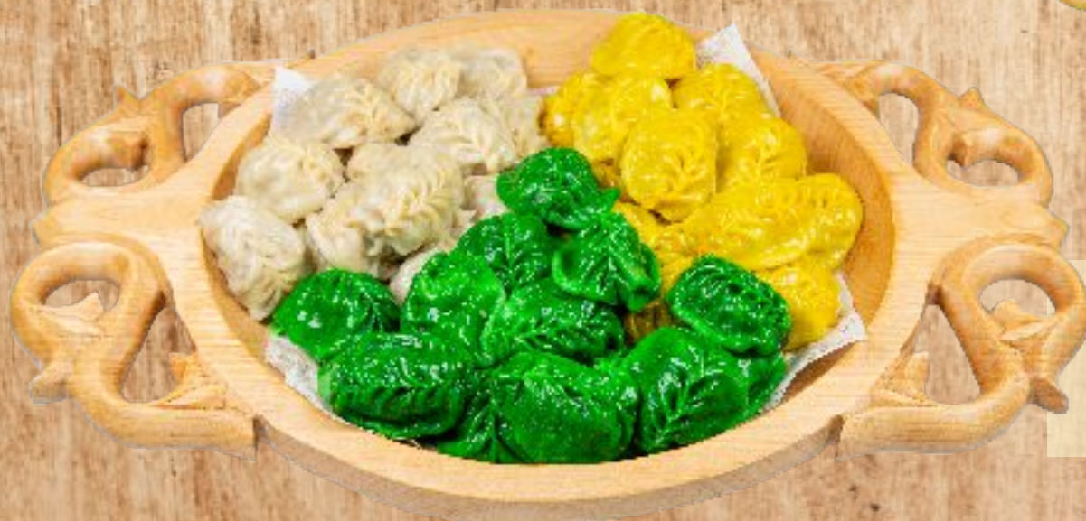
Манты в ассортименте 45 шт 28 000 тг (конина, говядина, баранина)